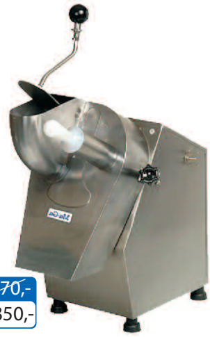
Krajalnica teflonowa 310pT